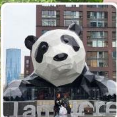
แพนด้าปิ่นตึก IFS