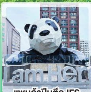
แพนด้าป็นตึก IFS