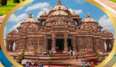
วิหารอักซาร์ดีม