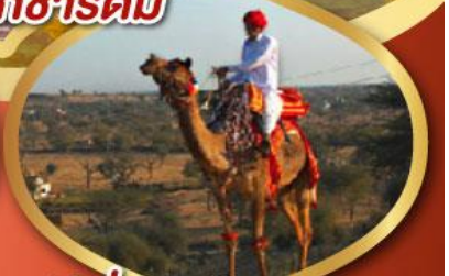
ฟรี ขี่อูฐ เมืองมันทอวา ราคาเริ่มต้น