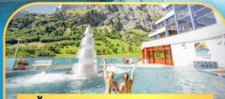
แช่น้ำแร่ร้อนผ่อนคลายลดยาคอร์บีค