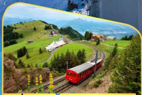
นั่งรถไฟขึ้นสู่ยอดเขาโรติก