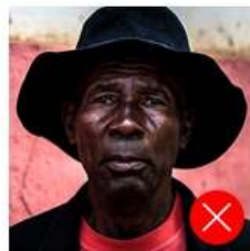
Back side is colored