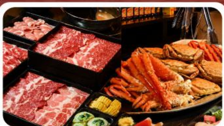
บุฟเฟต์ชาบู ขาปู 3 ชนิด

25-31 ต.ค.69 04-10 พ.ย.69 28 ต.ค.-03 พ.ย.69 11-17 พ.ย.69