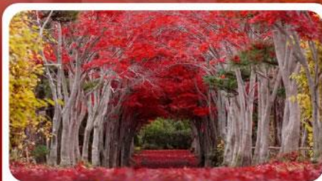
สวนลับชิราโอกะ