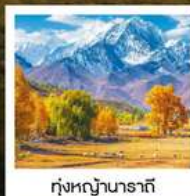
ทุ่งหญ้านาราที

ทัวร์คุณธรรม ไม่ลงร้านช้อปปิ้ง ไม่ขายออฟชั่น