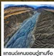
แกรนด์แคนยอนตู้ซานจือ