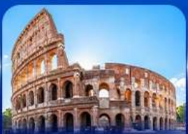
เข็ควินดัง โคลอสเซียม โรม