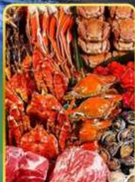
ปิ้งย่างพรีเมียมมันตะ