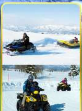
BIBAI SNOW LAND