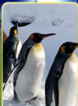
พาเหรดกเพนกวิน