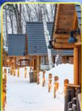
มิงเกิ้ลทอเร