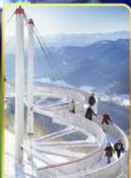
ระเบียงหมอกน้ำแข็ง