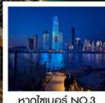
หาดไซเบอร์ NO.3

ทัวร์คุณธรรม ไม่ลงร้านช้อปปิ้ง ไม่ขายออฟชั่น