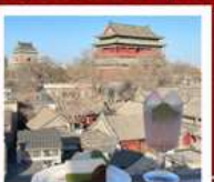
คาเฟ่ น้ำตาล