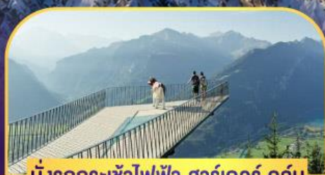
นั่งรถกระเช้าไฟฟ้า ชาร์เตอร์ ดูคัม