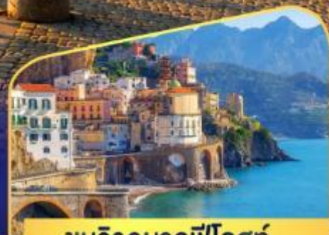
ชมวิวมอลฟีโคสก์