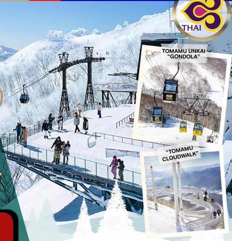
"TOMAMU UNKAI "GONDOLA"