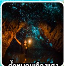
ถ้ำทอนเรืองแสง ไวโตโม