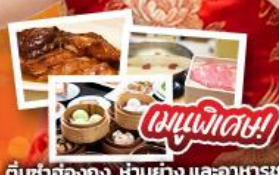
ต้มยำฮ่องกง, ห่านย่าง และอาหารชาบู