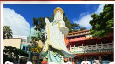
เจ้าแม่กวนอิมรัฟลีสเบย์