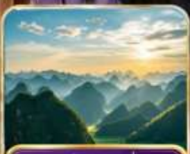
อุทยานป่าภูเขามินหยอด (รวมรถแบคเตอร์ )