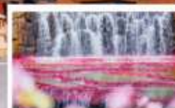
น้ำตกทะเลสาบ 7 สี

🗳️ โหลด 23 KG. x1 ทั้งไป - กลับ ✓ ฟรีมัสมั ✗ ไม่เข้าร้านรัฐบาล ✓ ทิวทัศน์เล็ก ✓ รวมค่าเข้าชมตามที่ตามโปรแกรม