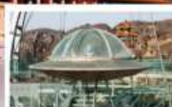
UFO Glass Platform