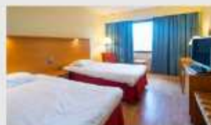
Twin สำหรับ 2 ท่าน