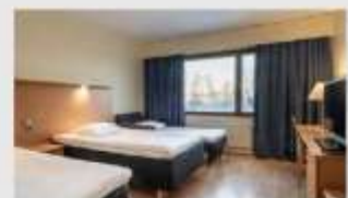
Triple สำหรับ 3 ท่าน