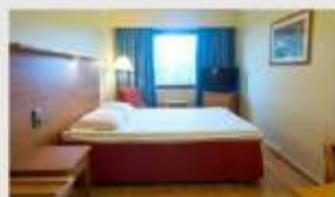
Double สำหรับ 2 ท่าน