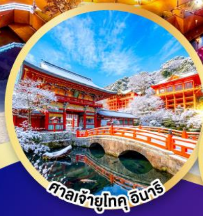
ศาลเจ้าโทคุอินาริ