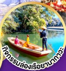
กิจกรรมล่องเรือยามากะ