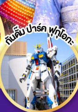
ทีมคิม ปาร์ค ฟุโตะ