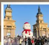
ตึกตาคีเย-ยักซ์