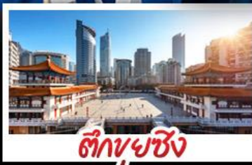
ตึกยูนซิง