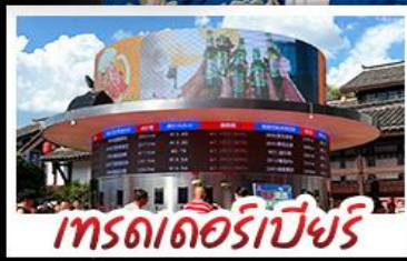
เทรตเล็ทรีเป็ยรี