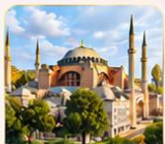
HAGIA SOPHIA โบสถ์เซนต์โซเฟีย