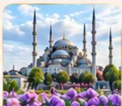
BLUE MOSQUE สุเหร่าสีน้ำเงิน