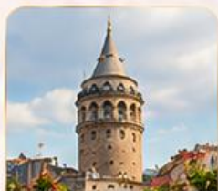
GALATA TOWER หอคอยกาลาตา