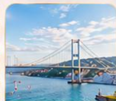
BOSPHORUS STRAIT ช่องแคบบอสฟอรัส