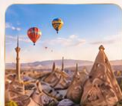
CAPPADOCIA คัปปาโดเกีย