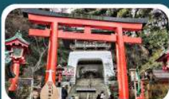
ศาลเจ้าอิโนะชิมะ

01-05 ก.ค.69 15-19, 18-22 ก.ค.69 30 ก.ค.-03 ส.ค. 69