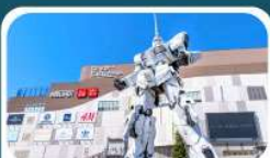
ห้างโตเวอร์ซิตี