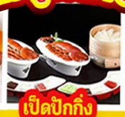
เปิดปีกกึ่ง