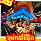
บุฟเฟต์ซีฟู้ด