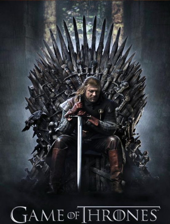
GAME OF THRONES