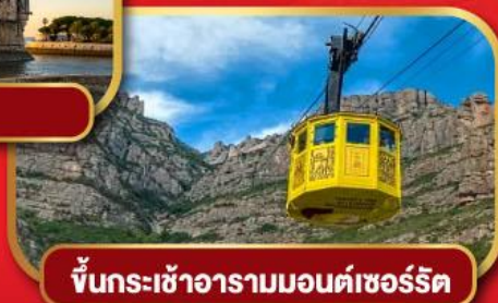
ขึ้นกระเช้าอารามมอนต์เซอรัลด์