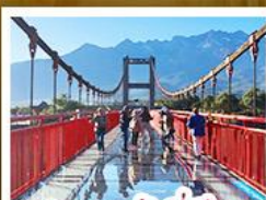
สะพานแก้วลีเจียง