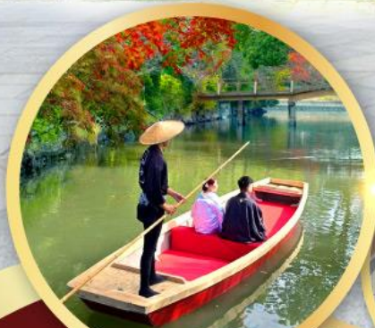
กิจกรรมล่องเรือยามากาวะ