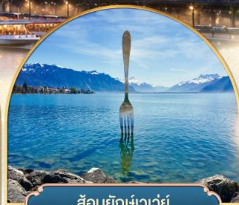
ล้อมยักเข่าเว่ย