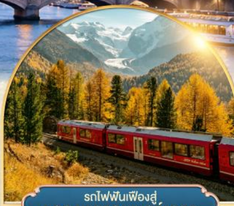
รถไฟฟันเฟืองสู่ยอดเขากรอนเนอร์เกรต