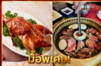
เปิดอย่างฮ่องกง บูฟเฟต์ปิ้งย่างเกาหลี