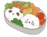
● อาหารสำหรับเด็ก ( 2-11 ปี ) *วัตถุประสงค์ขึ้นอยู่กับทาว์ราน