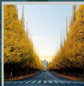
"ICHONAMIKI GINGO AVENUE"