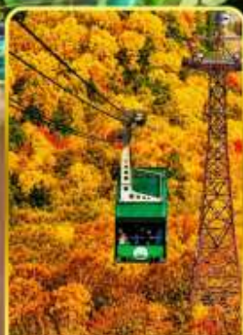
กระเช้าคุโรดากะ