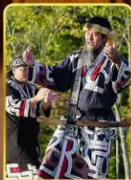
พิพิธภัณฑ์โอนู