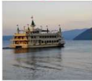
ล่องเรือทะเลสาบไทยะ