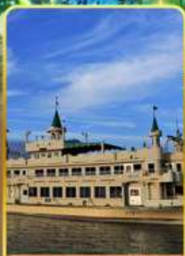
ล่องเรือทะเลสาบโทยะ