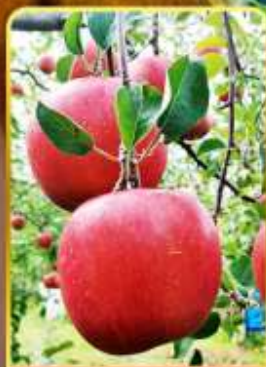
เก็บแอปเปิล