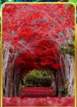
สวนฮิราโอกะ