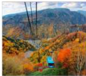
นังกระเช้าคุโรดากะ