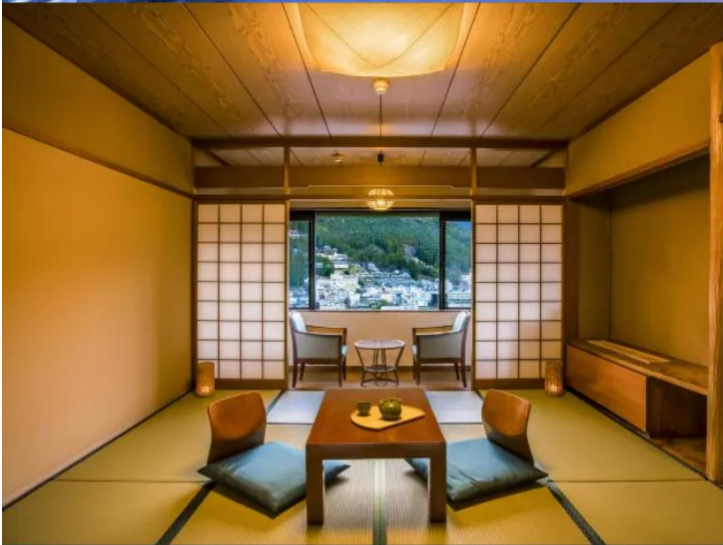
Standard Japanese-style Room 49.5m