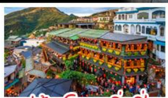
หมู่บ้านโบราณจิ่วเฟิ่น