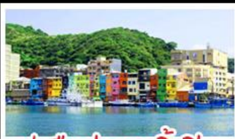
ทำเรือประมงเจิ้งปิ่น

รถไฟสายโบราณอาลีซาน - ตักไทเป 101 ประมงเจิ้งปิ่น - จิวเฟิ่น - ล่องเรือทะเลสาบสุริยันจันทรา ถนนเมบูเค็ด เสี่ยวหลงเป่า & ปลายประธาราธิบดี ช้อปปิ้ง 3 ย่านดัง : ซีเหมินดิง - ไถจงไนท์มาร์เก็ต - MITSUI OUTLET