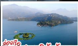
ส่องเรือทะเลสาบสุริยันจันทรา