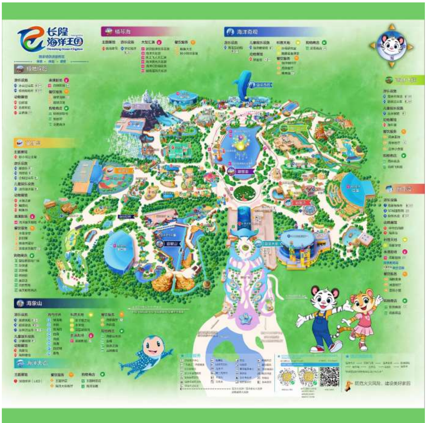
แผนที่ CHIMELONG OCEAN KINGDOM