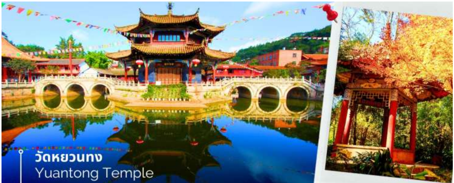
วัดหยวนทอง Yuantong Temple

นำท่านชม วัดหยวนทอง (Yuantong Temple) วัดแห่งนี้เป็นวัดที่ใหญ่และเก่าแก่ที่สุดในเมืองคุนหมิง สร้างมาตั้งแต่สมัยราชวงศ์ถัง มีอายุยาวนานประมาณ 1,200 กว่าปี การสร้างวัดแห่งนี้จะแปลกตากว่าวัดอื่นในจีน เพราะปกติแล้วการสร้างวัดของจีนส่วนมากจะต้องสร้างอยู่บนภูเขา แต่วัดหยวนทองสร้างวัดต่ำกว่าภูเขา โดยวิหารจะอยู่ต่ำที่สุดเนื่องจากวัดแห่งนี้ไม่ได้สร้างขึ้นเพื่อเป็นวัดโดยตรง แต่เคยเป็นศาลเจ้าแม่กวนอิมมาก่อน