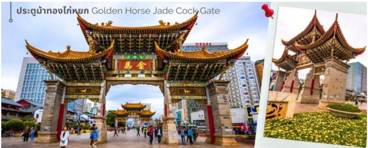
ประตูม้าทองไก่หยก Golden Horse Jade Cock Gate

ค่ำ 10! รับประทานอาหารค่ำที่ภัตตาคาร (14)