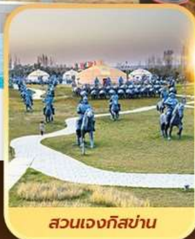
สวนเจงกิสข่าน