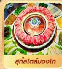
สุกีสโตลมองโก