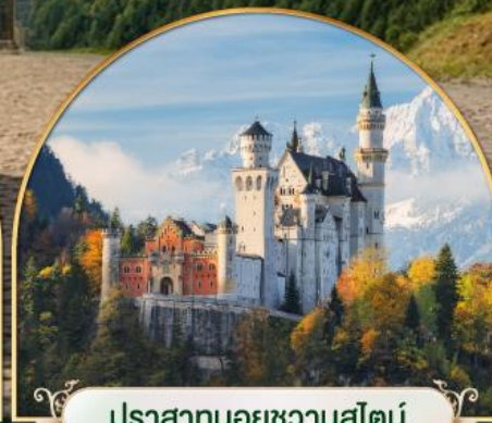
ปราสาทนอยชวานสไตน์ เยอรมัน