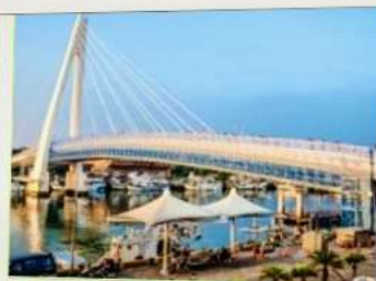
สะพานคู่รักตั้นสุ่ย