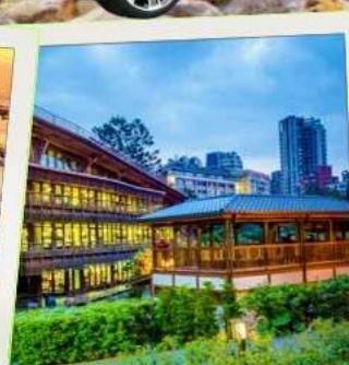
ห้องสมุดเป่ย์โถว