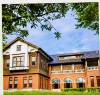
พิพิธภัณฑ์น้ำพุร้อนเป่ย์โถว