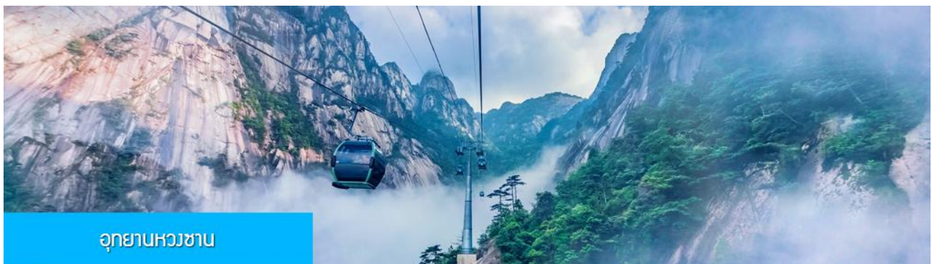
อุทยานหวางซาน