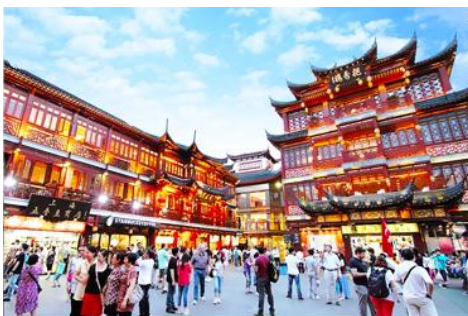
ตลาดเจิงหวงเมี่ยว

รับประทานอาหารเช้า ณ ห้องอาหารของโรงแรม (6)