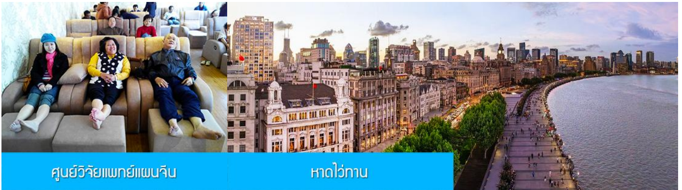
ศูนย์วิจัยแพทยแผนจีน