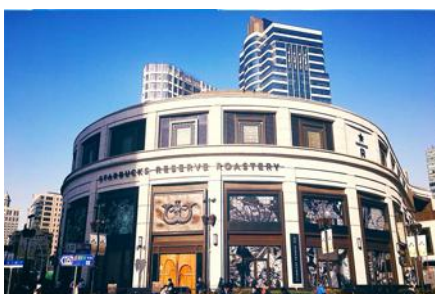
Starbuck Reserve Roastery