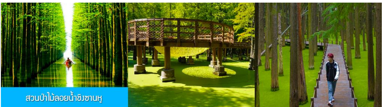
สวนป่าไม้ลอยน้ำชิงซานหู

หลังอาหารเช้าท่านเดินทางโดยรถบัสสู่เมืองหลิงอัน 临安市 (ระยะทาง 175 กม. ใช้เวลาเดินทางราว 2 ชั่วโมงเศษ)