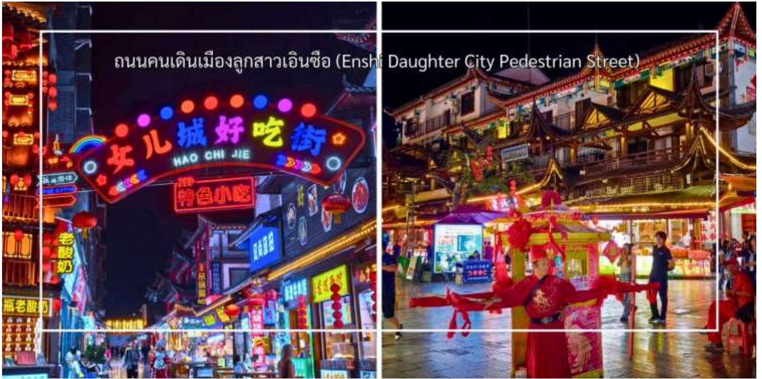
ถนนคนเดินเมืองลูกสาวเินซือ (Enshi Daughter City Pedestrian Street)