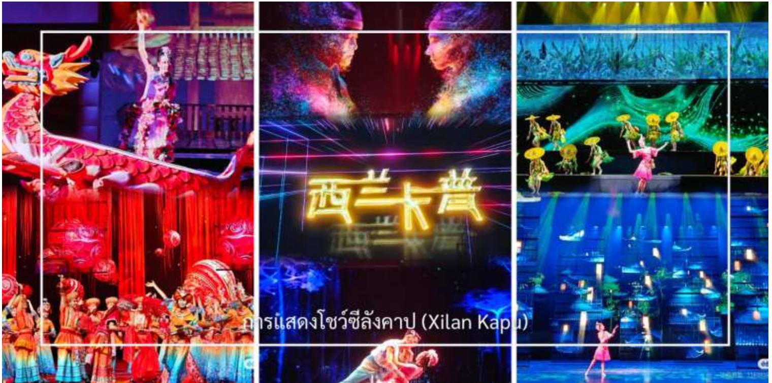
การแสดงโชว์ซีลิ่งคาปู (Xilan Kapu)

การแสดงซีลิ่งคาปู (Xilan Kapu) หนึ่งในศิลปวัฒนธรรมพื้นเมืองอันทรงคุณค่าของชนเผ่าตูเจีย โดยถ่ายทอดเรื่องราววิถีชีวิต ความเชื่อ และเอกลักษณ์ของท้องถิ่นผ่านการแสดงที่ผสมผสานระหว่างดนตรีพื้นบ้าน การขับร้อง และงานทอผ้าอันประณีต