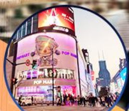
ถนนหนานจิง