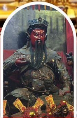
วัดกวนโถ

ขอเทพเจ้ากวนอู ความซื่อสัตย์ เงินทอง ธุรกิจมั่นคง