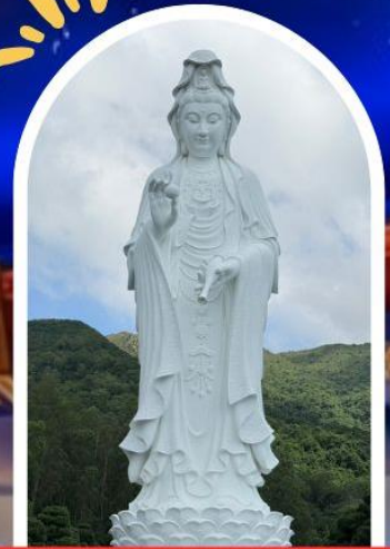
วัดซีซัน