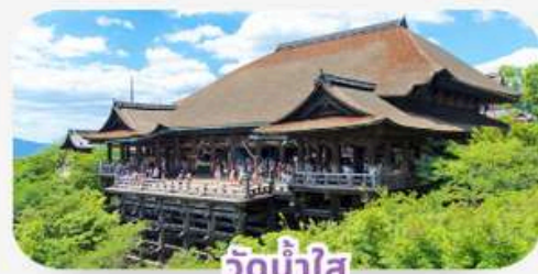
วัดน้ำใส