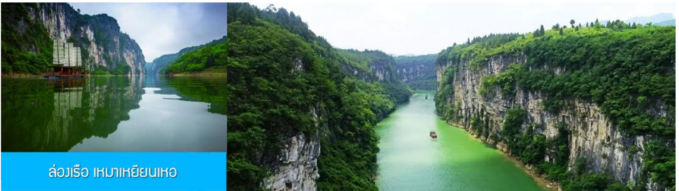
ล่องเรือ เหมาเหยียนเหอ