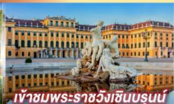
เข้าชมพระราชวังฮินบรุนน์