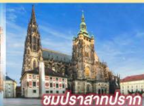
ชมปราสาทปราท