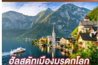
อัลสติกเมืองมรดกโลก