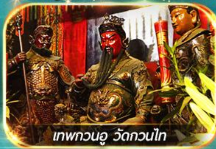
เทพกวนอู วัดกวนไท

พามุไหว้พระ-ขอพร 8 วัดดัง, อิสระช้อปปิ้ง 1 วันเต็มแบบจุใจ