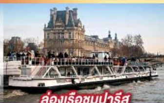
ล่องเรือชมปารีส