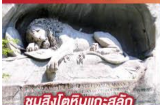
ชมสิงโตหินแกะสลัก