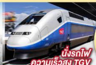
นั่งรถไฟ ความเร็วสูง TGV